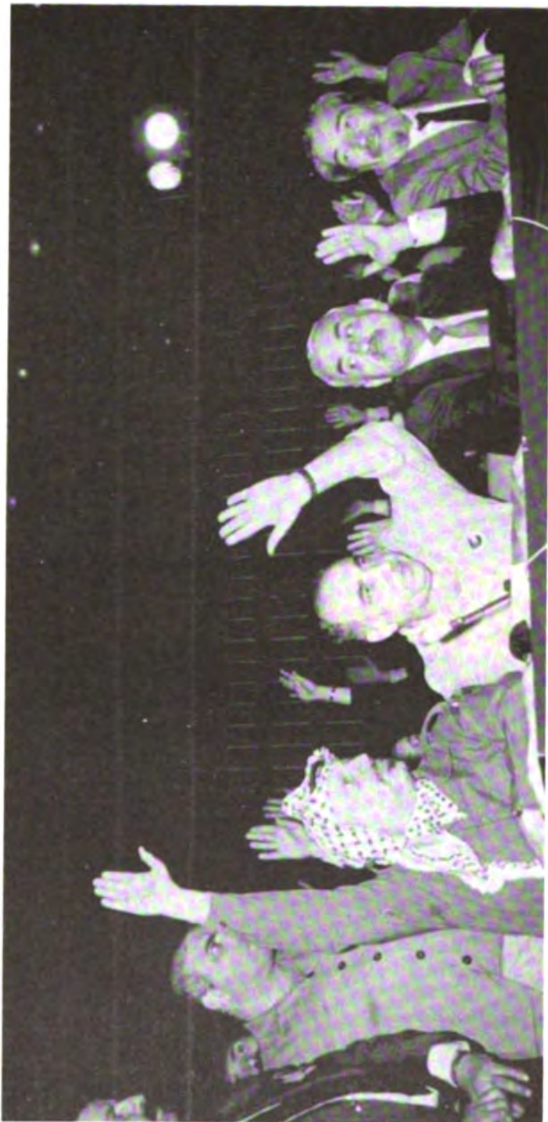
مع جورج حبش وأبو إياد